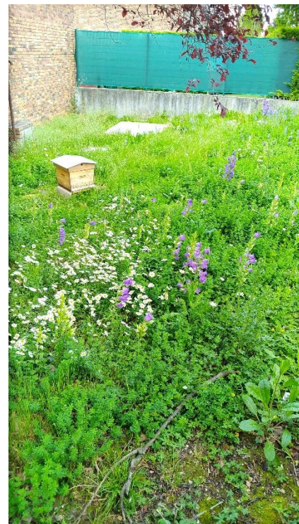
Angle Arnoux/Salengro 05/20