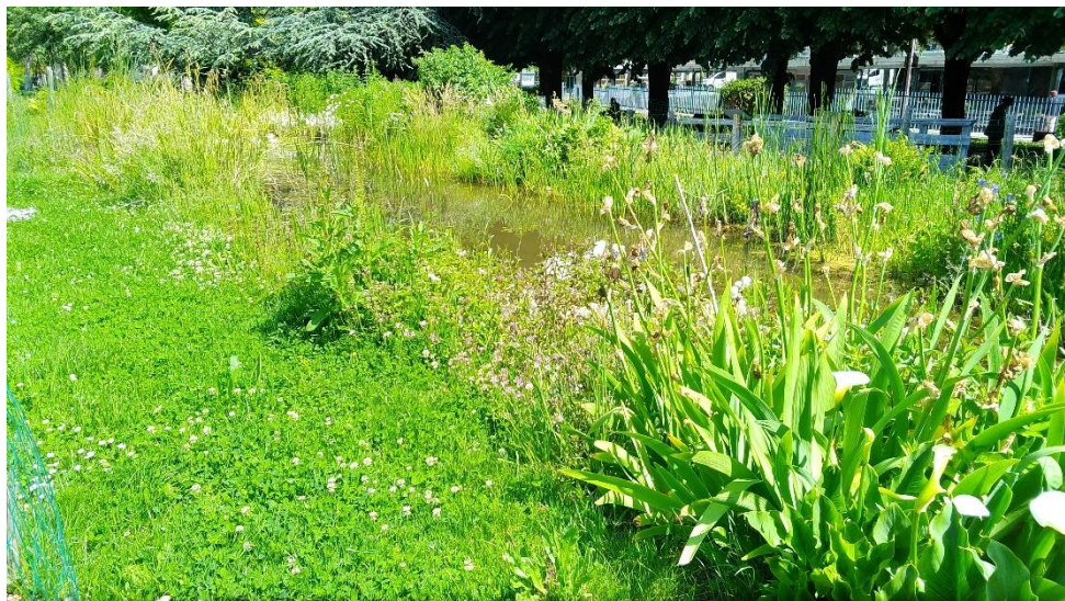
Nouvelle mare au Square du Serment-de-Koufra 06/21