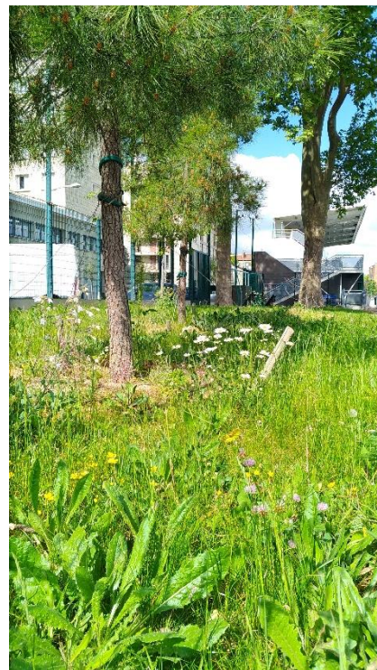
Stade Lezer 05/20