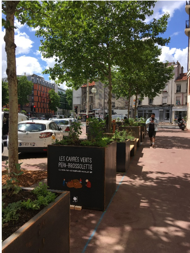
Carrés verts Péri Brossolette