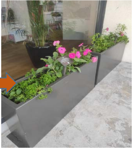
Bac Permis de végétaliser