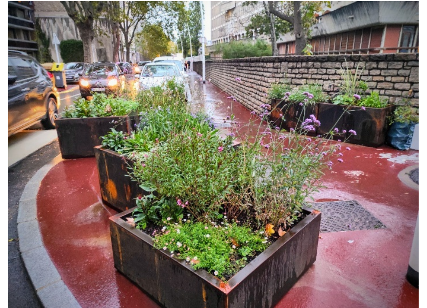
1 demande pour un carré Angle Pasteur/Arnoux