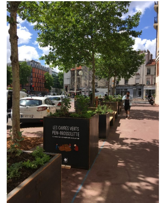
26 bacs Angle Péri / Brossollette