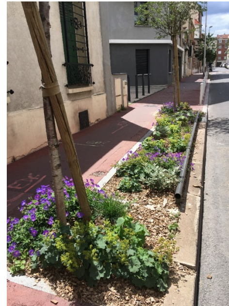
1 permis : rue Auber*