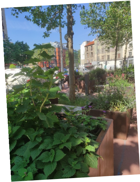
2 permis : Carrés verts Péri Brossolette