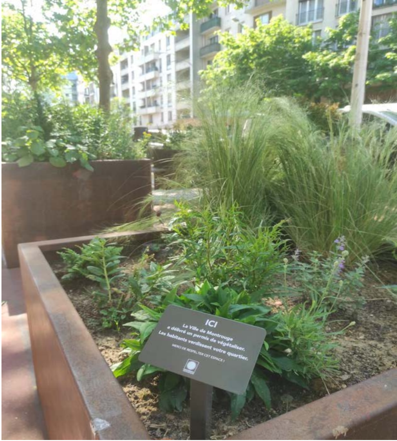
Carrés Verts Péri Brossolette : 2 permis en cours