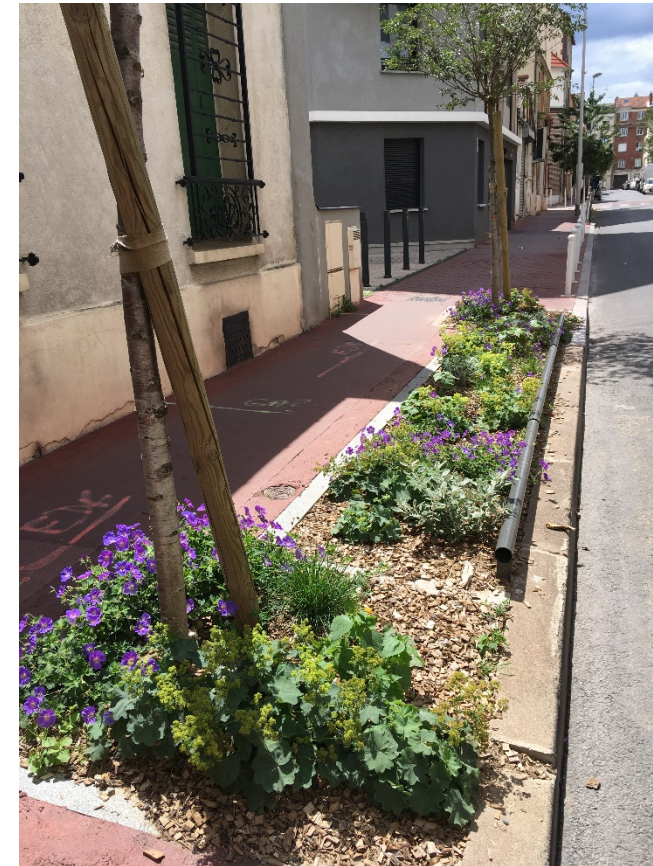
Rue Auber 2020, Montrouge

Permettre aux citoyens qui le souhaitent de cultiver sur l'espace public... avec un permis de végétaliser.