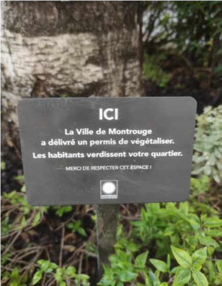
Panneau indicatif du permis de végétaliser