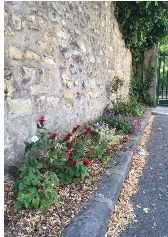
Rue Gutenberg, 2019 et 2020, Montrouge

Permettre aux citoyens qui le souhaitent de cultiver sur l'espace public... avec un permis de végétaliser.