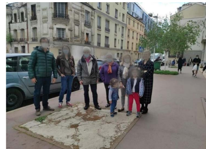
Habitants 56/54/52 Avenue Gabriel Péri motivés par les Permis de végétaliser