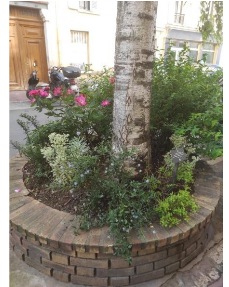
1 permis : 18 rue Edgar Quinet