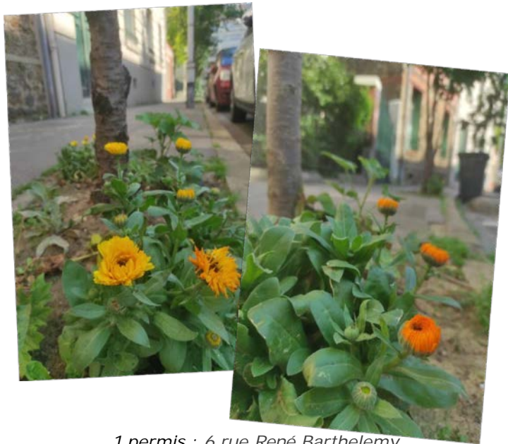
1 permis : 6 rue René Barthelemy