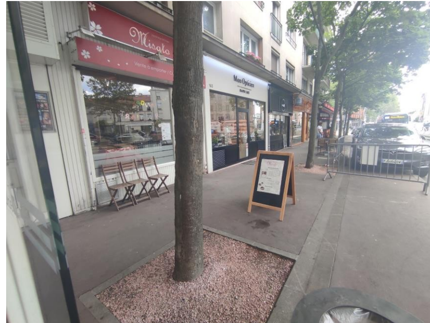
9 pieds d'arbres à végétaliser en pleine terre à partir du 103 Avenue Gabriel Péri