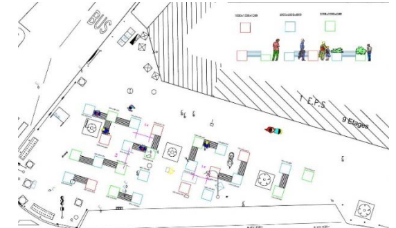
26 bacs Angle Péri / Brossollette